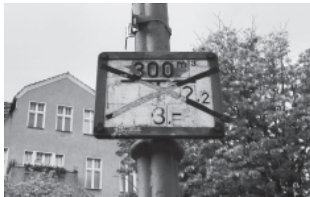
Das Versorgungsschilder zeigt, wo sich die Abfüllstelle der Zisterne mit einem Füllvermögen von 300 Kubikmetern auf dem Kranoldplatz befindet. Die gekreuzten, schwarzen Balken zeigen an, dass sie nicht mehr in Betrieb ist.

Hydranten sind ausschließlich Anschlusseinrichtungen zur Wasserentnahme aus dem Rohrnetz der zentralen Wasserversorgung. Sie befinden sich meistens unter Straßenklappendeckeln. Aus diesen Unterflurhydranten kann mit einem Fördergerät Wasser entnommen werden.