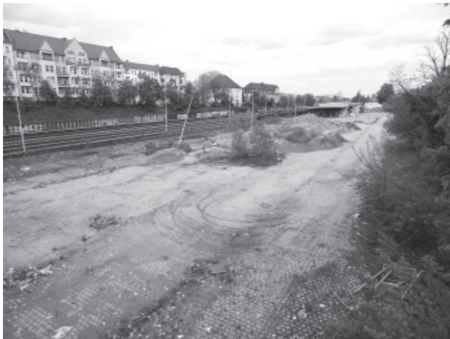
Der alte Güterbahnhof

An vielen Stellen in Neubritz wird gebaut. Bei der einen Baustelle geht es recht zügig voran, bei anderen Baustellen zieht es sich hin. Nach Eigentümerwechsel der Grundstücke Bürgerstraße 21, 25 und 27 soll hier neuer Wohnraum und eine Kindertagesstätte entstehen. Im Zuge der Neugestaltung wird wohl die alte Villa in der Bürgerstraße 21 abgerissen werden. Sie steht nicht unter Denkmalschutz.